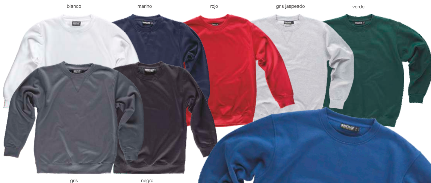
blanco marino rojo gris jaspeado verde gris negro azul