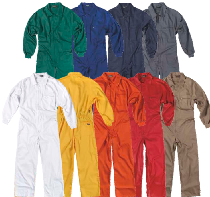
blanco amarillo naranja rojo beige