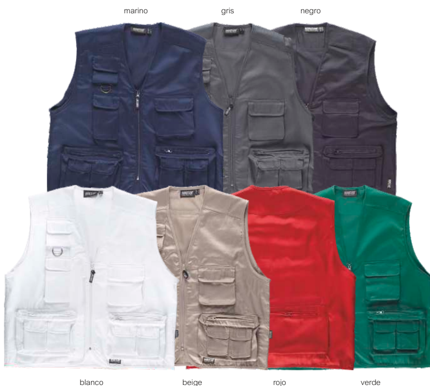
marino gris negro blanco beige rojo verde

Tejido: 65% Poliéster 35% Algodón (200 g/m2)