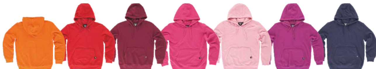
naranja rojo granate fucsia rosa claro burdeos marino