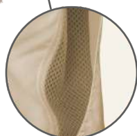
Rejilla en la espalda.