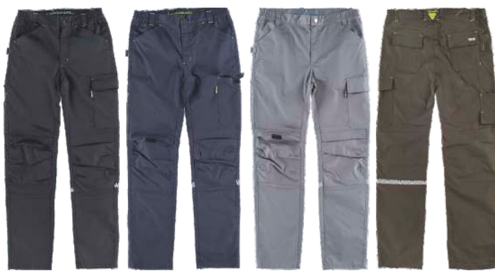
negro marino gris verde caza

TEJIDO ELASTIC TEJIDO MECHANICAL STRETCH Se trata de un tejido "elástico por construcción", es decir, la elasticidad viene dada por la disposición de las fibras del tejido. Al no estar presentes componentes elásticos en su composición, este tipo de tejido es más resistente y duradero, pudiendo soportar temperaturas más altas de lavado, lo cual nos facilita la limpieza de las prendas.