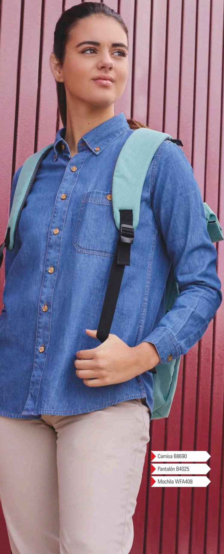
▶ Camisa B8690