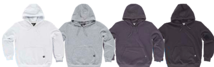
blanco natural gris jaspeado gris oscuro negro