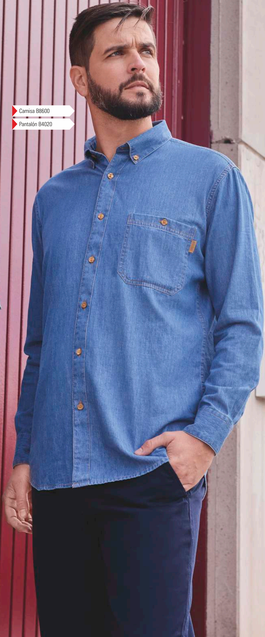
▶ Camisa B8600