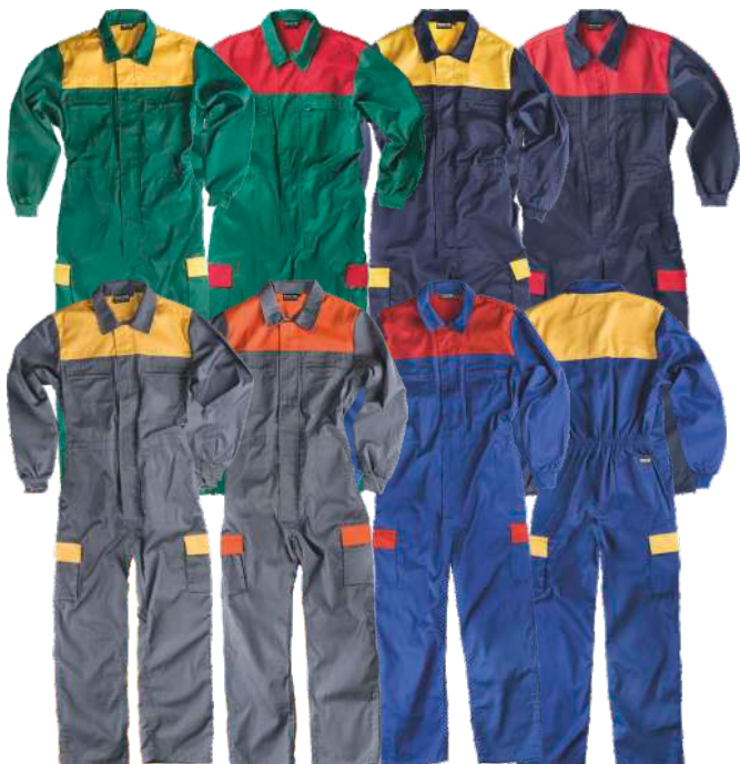
gris/amarillo gris/haranja azulina/rojo azulina/amarillo