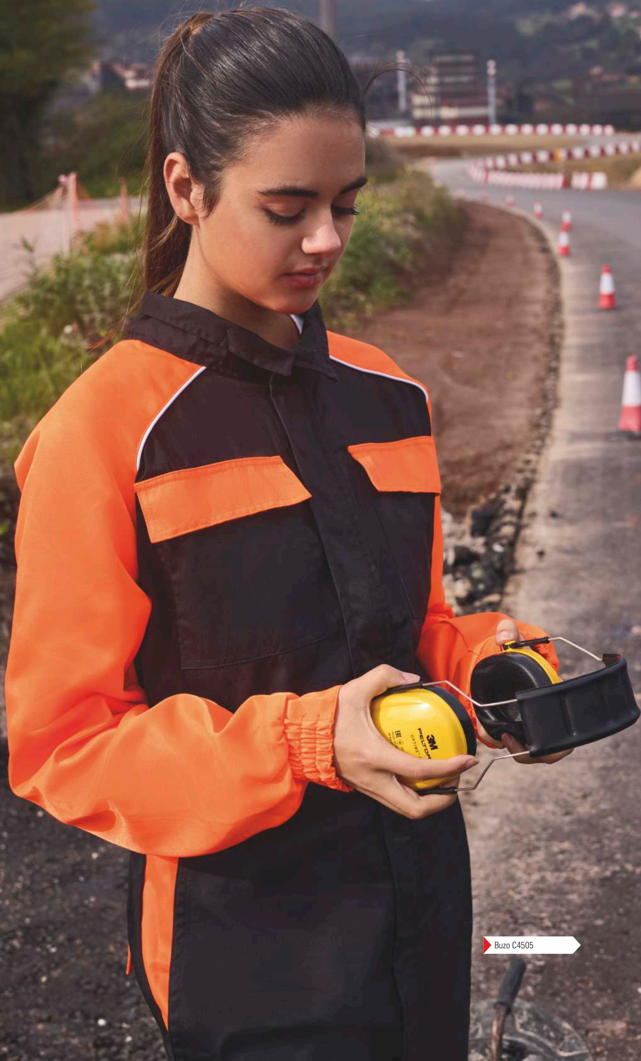
► Buzo C4505