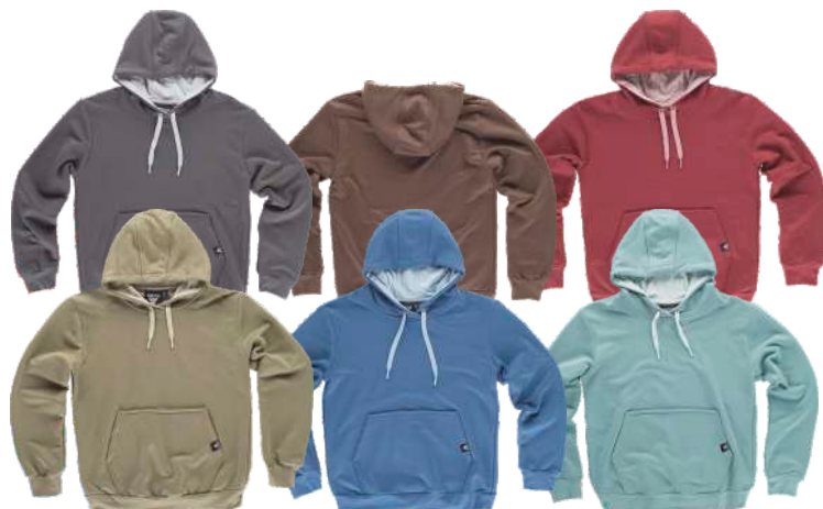
verde oliva/verde topo azul/celeste verde agua/verde agua claro