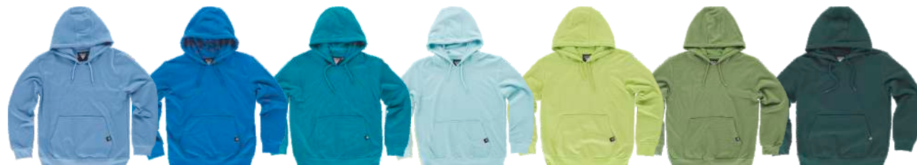
celeste azul turquesa oscuro turquesa claro verde lima verde oliva verde oscuro