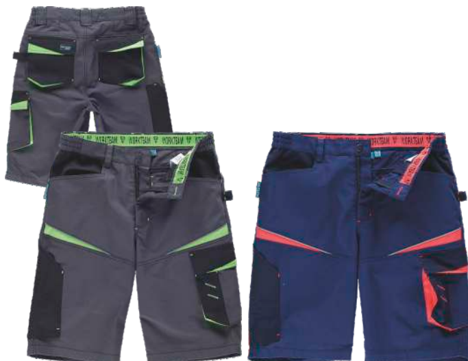
gris oscuro/negro/verde lima

Tejido: 65% Poliéster 35% Algodón (270 g/m2)