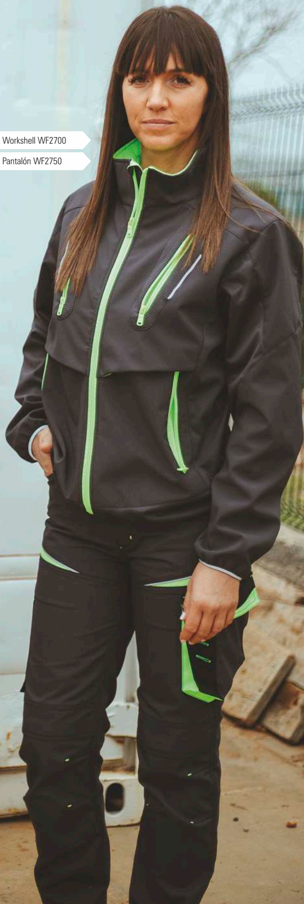
▶ Pantalón WF2750