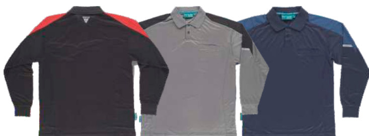
negro / rojo