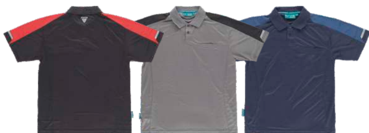
negro / rojo