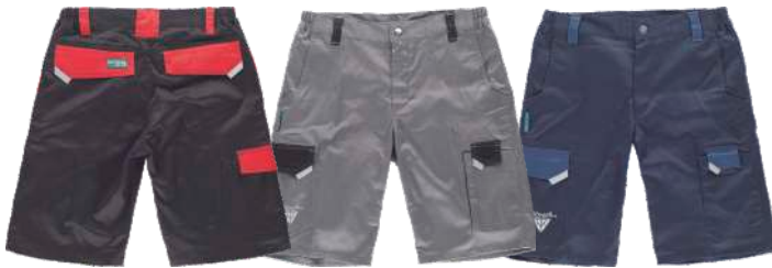
negro / rojo