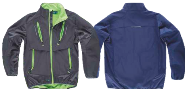
gris oscuro/verde lima