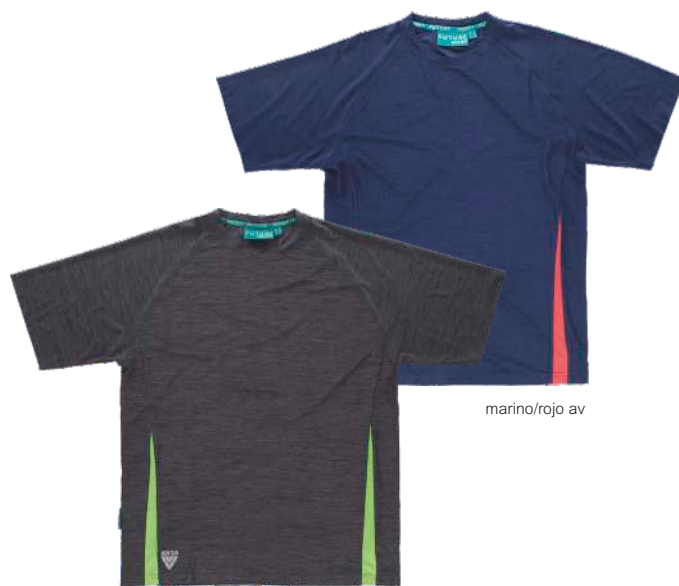
gris oscuro/verde lima