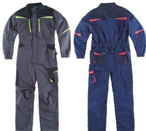
gris oscuro/negro/verde lima