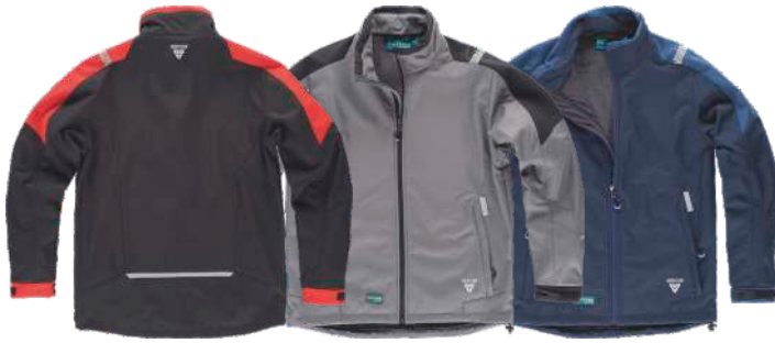
negro / rojo