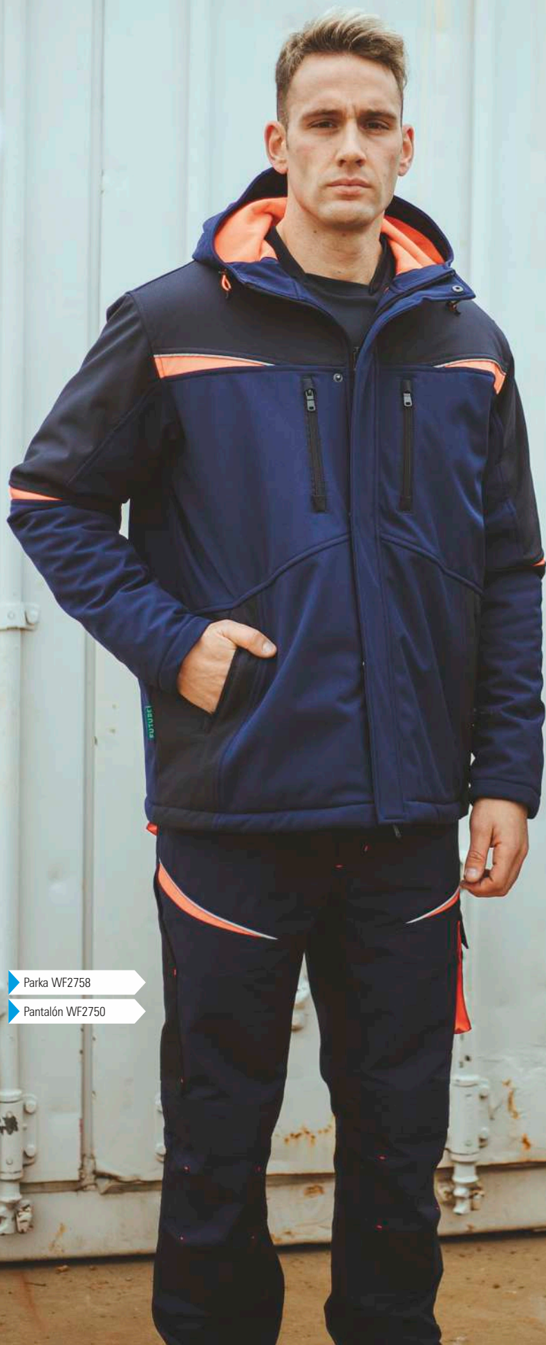
▶ Parka WF2758