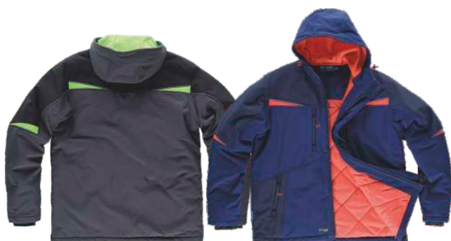
gris oscuro/negro/verde lima