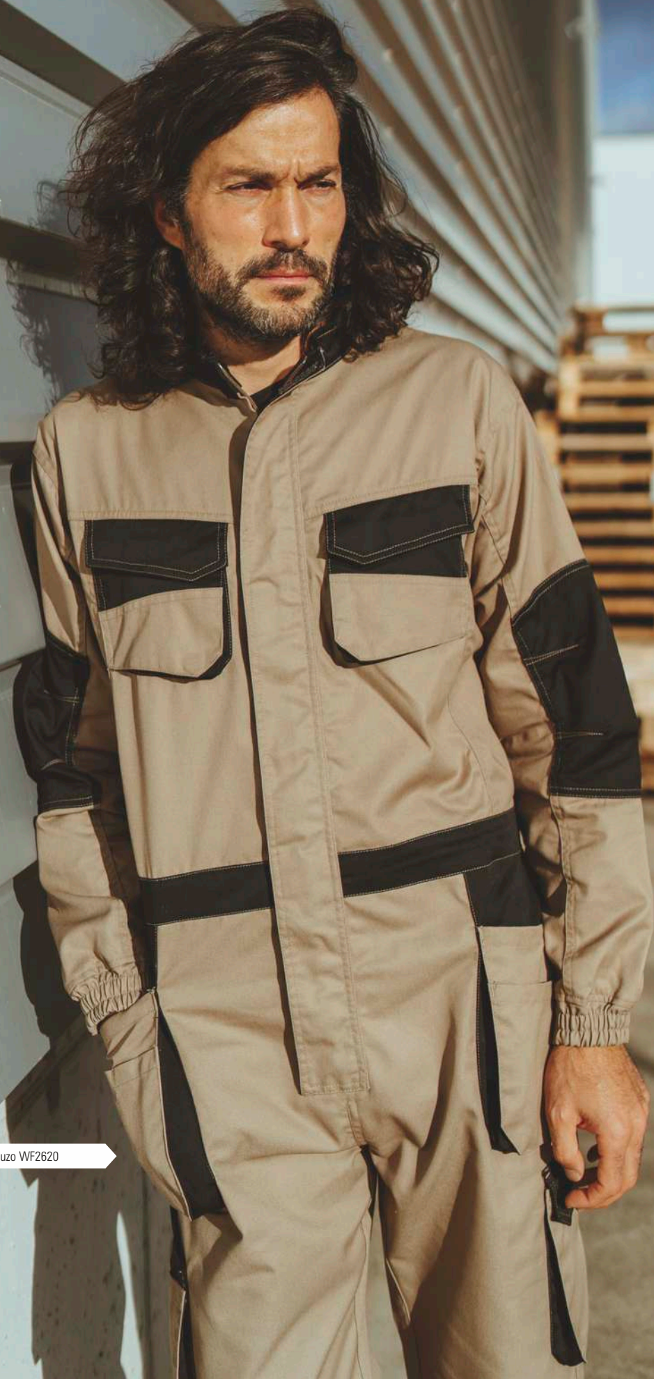
▶ Buzo WF2620