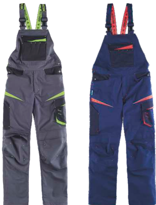
gris oscuro/negro/verde lima

Tejido: 65% Poliéster 35% Algodón (270 g/m2)