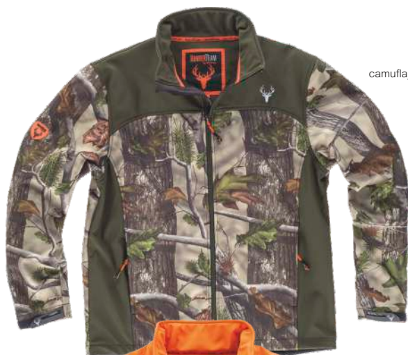
camuflaje bosque verde/verde caza