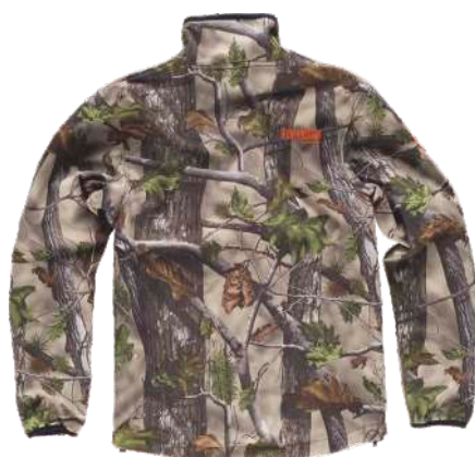
camuflaje bosque verde

Tejido: 96% Poliéster 4% Elastano (300 g/m 2 )