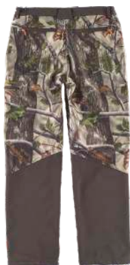
camuflaje bosque verde/marrón