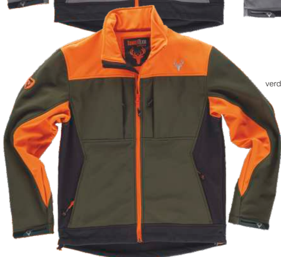
verde caza/negro/naranja a.v.