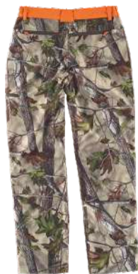
camuflaje bosque verde/naranja a.v.