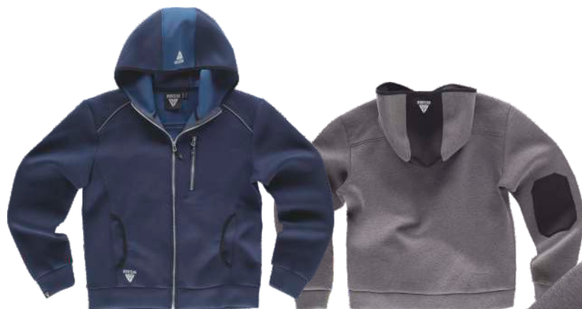
marino / azafata