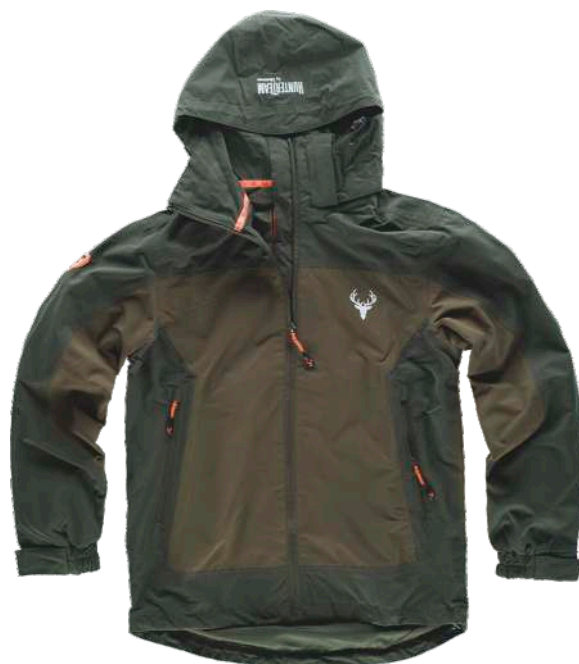
verde bosque/verde oliva

Tejido Exterior: 100% Poliéster (130 g/m 2 ) Tejido Interior: 100% Poliéster (65 g/m 2 )