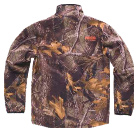
camuflaje bosque marrón