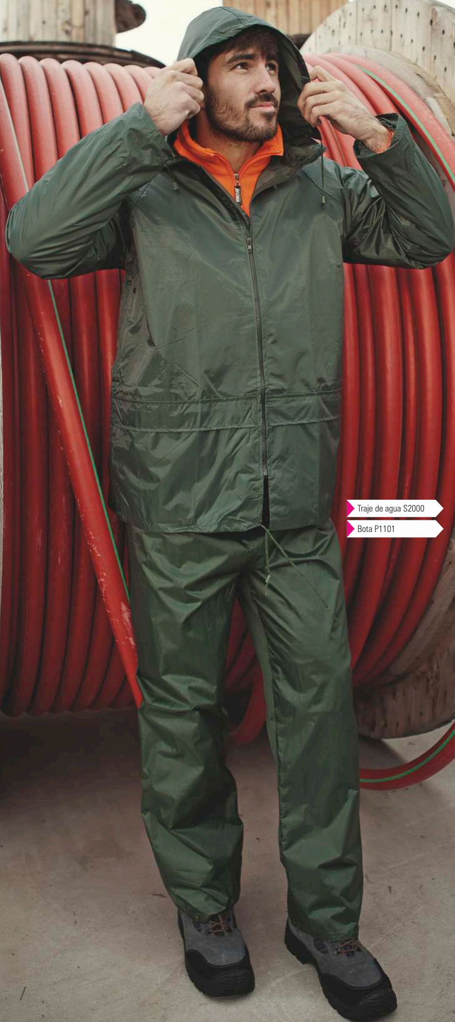
Traje de agua S2000