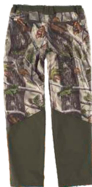
camuflaje bosque verde/verde caza