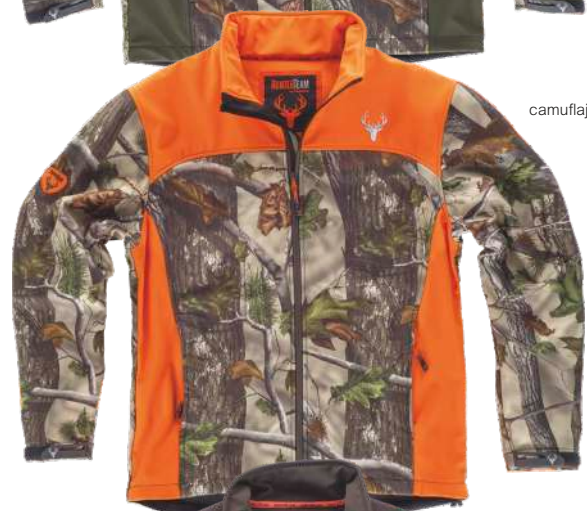
camuflaje bosque verde/naranja a.v.