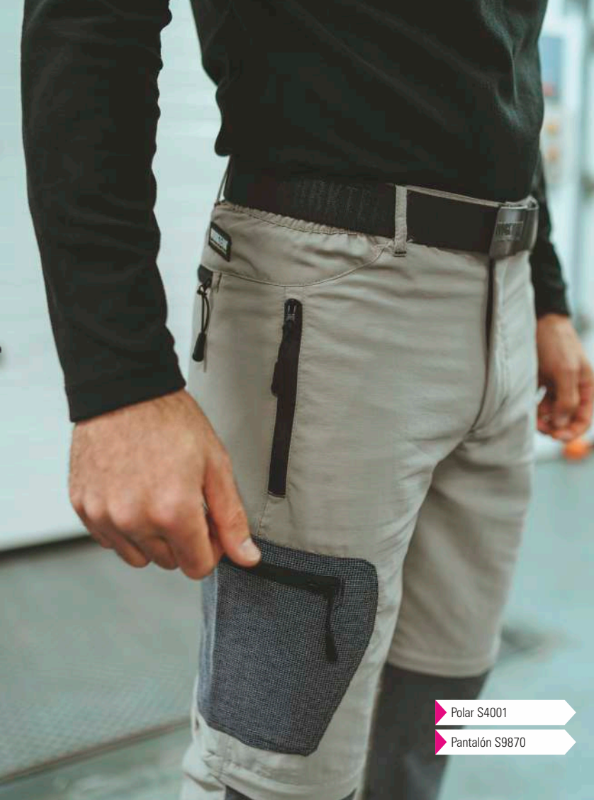
▶ Polar S4001 ▶ Pantalón S9870