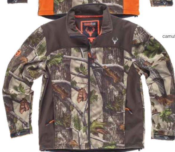
camuflaje bosque verde/marrón