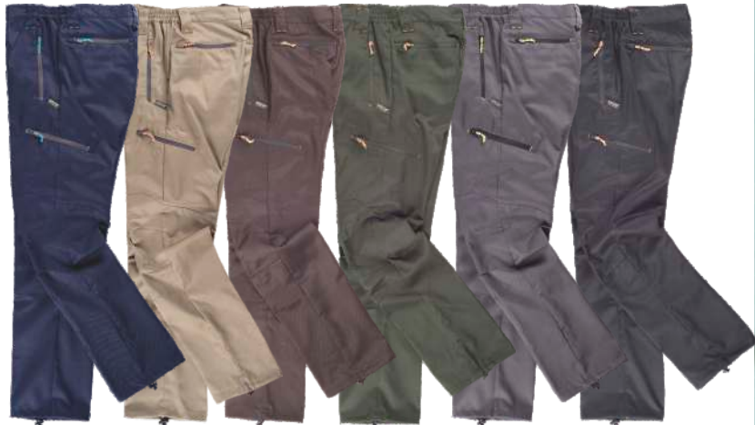
marino beige marrón verde caza gris negro